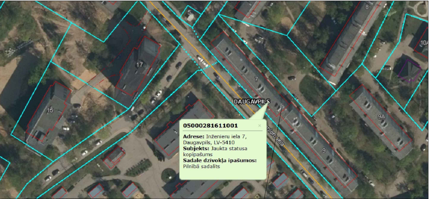
INŽENIERU IELA 7, DAUGAVPILS